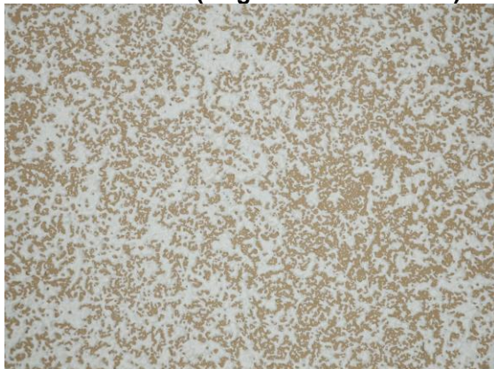
Rand- en hoekzones (130 g/m 2 → 80 m 2 /can.)