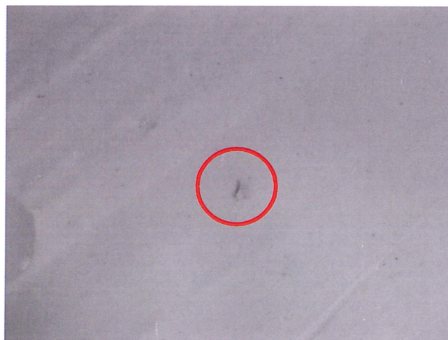
Foto 2: Untersuchungsmaterial SILIRUB Cleanroom, CH 200054801, Farbe weiß nach einer Inkubationszeit von 28 Tagen mit geringem Pilzwachstum (50fach vergrößert)